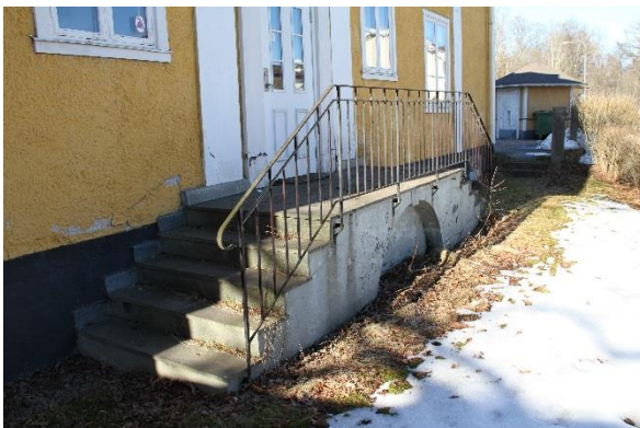
Bild 7. Trappen till trädgården på byggnadens östfasad.