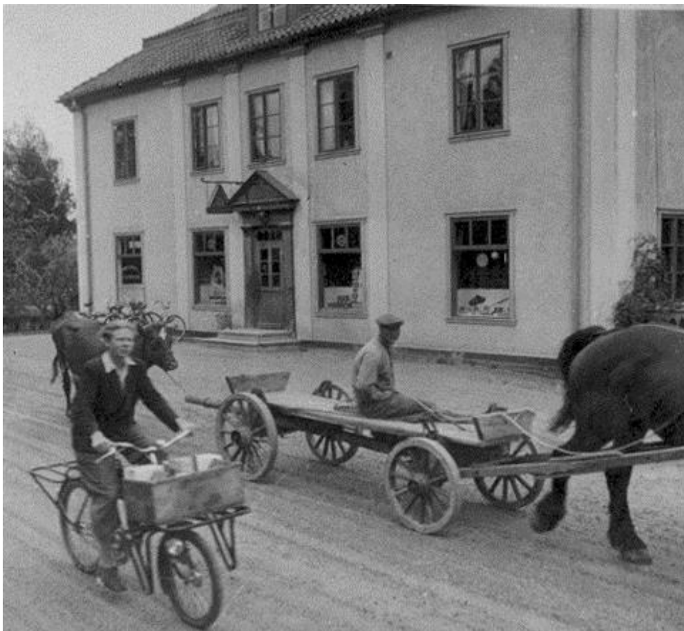
Bild 1. Köpmangården, fasad mot Ekebyvägen. Bilden är troligen från 1940-talet.

Första belägget för bro över sundet är från 1645, men det är troligt att det funnits en bro mycket tidigare än så. Under 1700 och 1800-talet växer Sunne och tätorten börjar ta form. Bruksetableringarna, avskaffande av skråväsendet samt införandet av näringsfrihet ger en ökad etablering av hantverkare och handel. Under samma period sker en utveckling av statliga och lokala administrationen och ett flertal institutioner inrättades. Ångbåtarna som livligt trafikerade Fryken gav upphov till att faktorier och bryggor anlades längs med sundet. Med tiden kom bebyggelsen i Sunne att förtätas än mer och 1905 bildades Sunne municipalsamhälle.