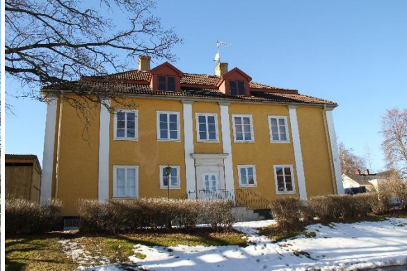
Bild 4. Köpmangården, fasad mot öst.