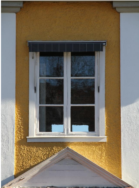
Bild 11 .Fönster och tympanonfält. Fasad mot väst.