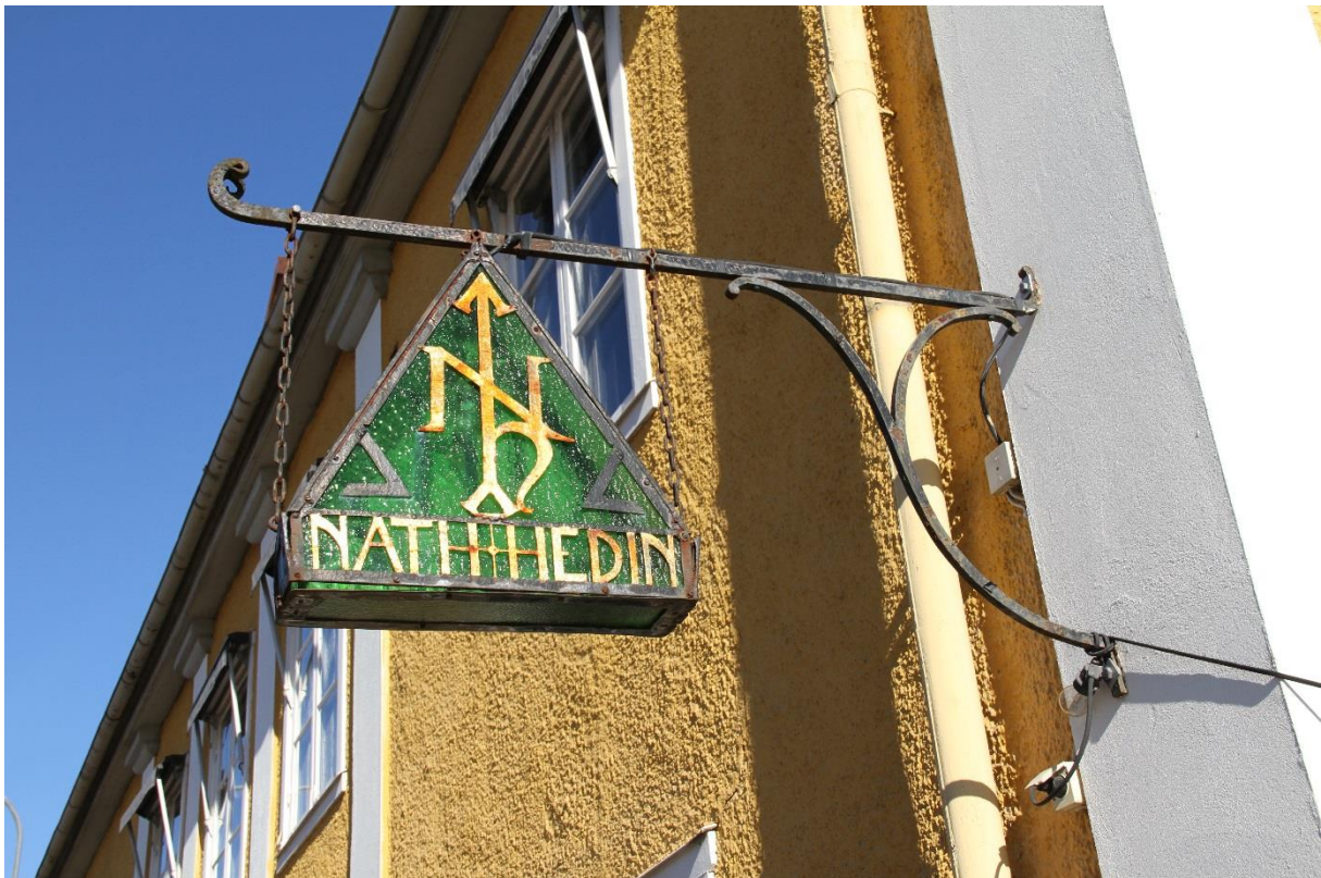
Bild 12. Skylden som tidigare hängde ovanför ingången till butiken.

Byggnaden är i det närmsta intakt, både vad gäller material som utförande. Detta innebär att byggnaden ger en tydlig avläsbarhet vad gäller material, byggnadsteknik, materiella förutsättningar och stilideal. Det är viktigt att material och allt som är i originalt utförande respekteras och får utgöra utgångspunkten för bevaring, förvaltning och utveckling av byggnaden.