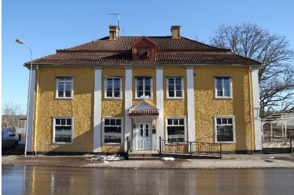
Bild 3. Köpmangården, fasad mot Ekebyvägen/väst.

Byggnaden präglas av 1920-tals klassicism där varje element i fasaden ingår som en viktig del av arkitekturen. Byggnadens fasad är strängt symmetriskt uppbyggd med pilastrar som delar upp fasaden, tympanonfält över entrén, symmetriskt placerade fönster och med två skorstenar. Samtliga element förstärker byggnadens arkitektoniska gestaltning.