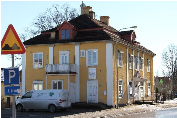
Bild 5. Köpmangården, fasad mot norr.