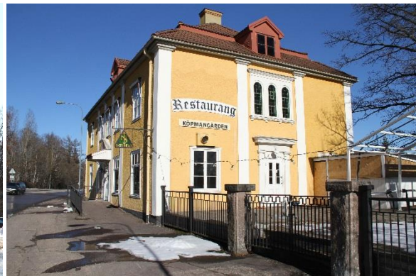
Bild 6. Köpmangården, fasad mot söder.