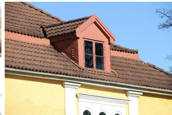
Bild 8. Detalj av takkupan på det södra takfallet.