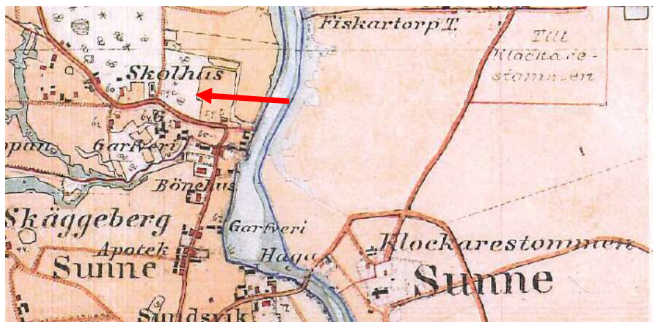
Figur 2. Utklipp från äldre karta där byggnaden omnämns som "skolhus"

Byggnaden för gamla Åmbergskolan byggdes på ca 1880-talet enligt Sunnes kulturmiljöprogram och användes som folkskola. Byggnaden är en tegelbyggnad i 1 ½ våning med oputsade tegelväggar. Taket är sadeltak med falsadplåt.