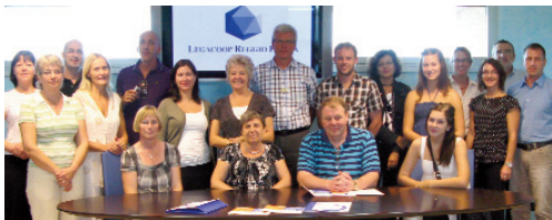
Sunnegruppen besökte flera framgångsrika kooperativ på resan.