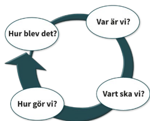
Figur 1 Kvalitetscirkel med texten: Hur blev det? Var är vi? Vart ska vi? Hur gör vi?

Förskolans utbildning och undervisning utgår alltid från målen i förskolans läroplan, det krävs engagerade och kompetenta lärare för att barnen ska lära och utvecklas utifrån dessa. För att få ett fungerande systematiskt kvalitetsarbete utgår vi från nuläge till förväntat läge utifrån nedanstående modell