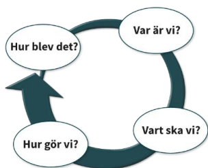
Figur 1 Kvalitetscirkel med texten: Hur blev det? Var är vi? Vart ska vi? Hur gör vi?

Förskolans utbildning och undervisning utgår alltid från målen i förskolans läroplan, det krävs engagerade och kompetenta lärare för att barnen ska lära och utvecklas utifrån dessa. För att få ett fungerande systematiskt kvalitetsarbete utgår vi från nuläge till förväntat läge utifrån nedanstående modell